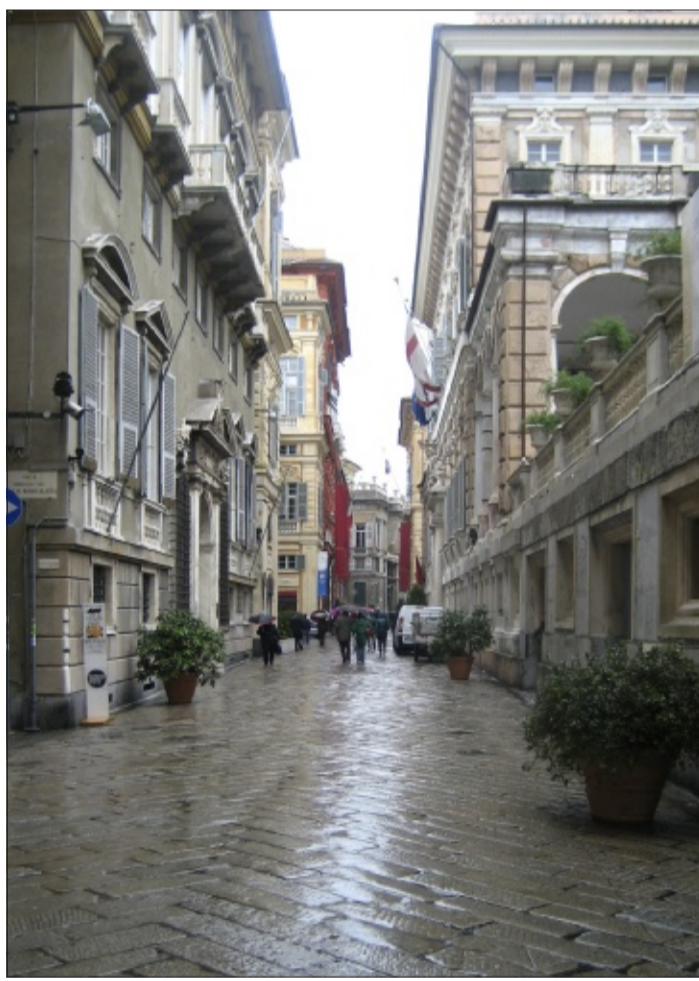
Via Garibaldi, Unescon maailmanperintökatu Genovassa.

Genovan matkailubudjetti on pieni, vain noin 500 000 euroa. Työntekijöitä on kolmeitoista. Vertailun vuoksi matkailun panostavassa Barcelonassa käytetään 32 miljoonaa euroa, ja työntekijöitä on 120.