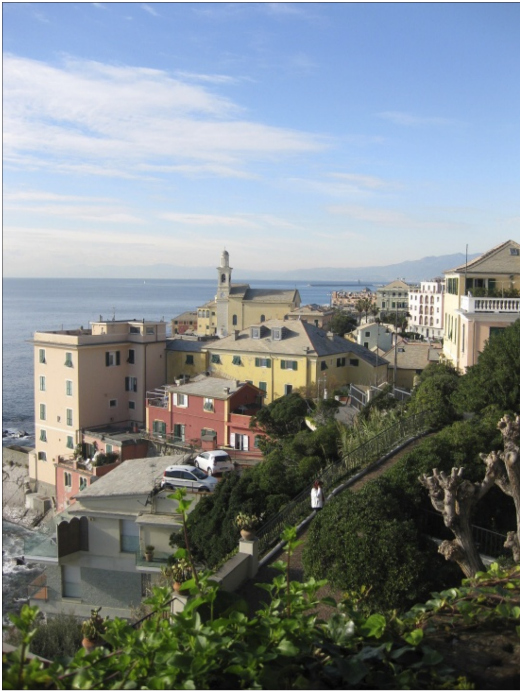
Boccadassen kaupunginosassa elämä soljuu rauhalliseen tahtiin, kuten entiselle kalastajakylälle hyvin sopii.

Toinen kuulu genovalainen oli viulutahturi Niccolò Paganini . Hänen mielisoitintaan Guarneri del Gesua eli il Cannonea säilytetään tarkoin vartioidussa, juuri oikeaan kosteusprosenttiin säädetyssä huoneessa palatsi Tursin museossa. Ihan pelkkä museoesine se ei ole. 12. loka-